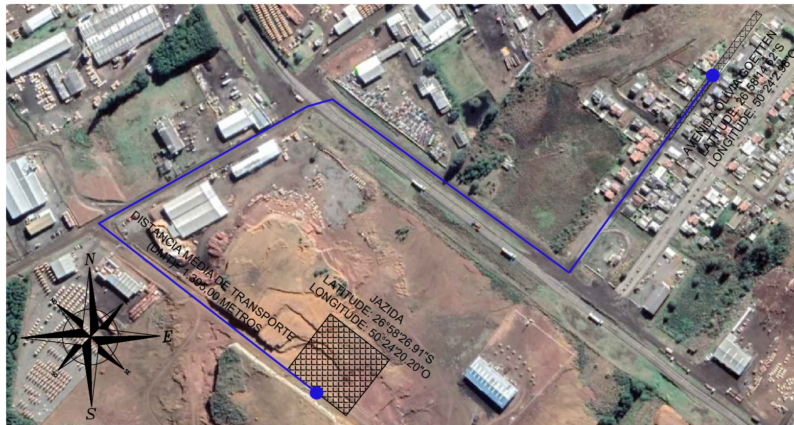
PLANTA DE LOCALIZAÇÃO DE JAZIDA ESC: 1/5000