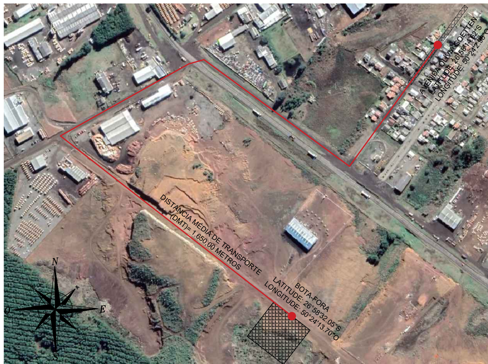
PLANTA DE LOCALIZAÇÃO DE BOTA-FORA ESC: 1/5000