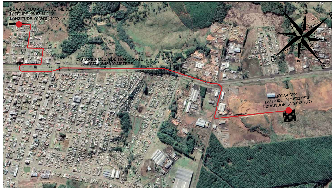
PLANTA DE LOCALIZAÇÃO DE BOTA-FORA ESC: 1/15000