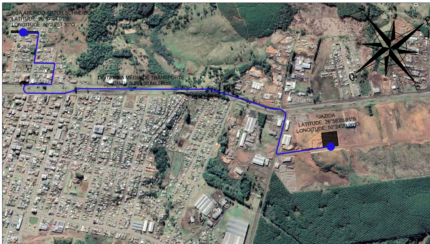
PLANTA DE LOCALIZAÇÃO DE JAZIDA ESC: 1/15000