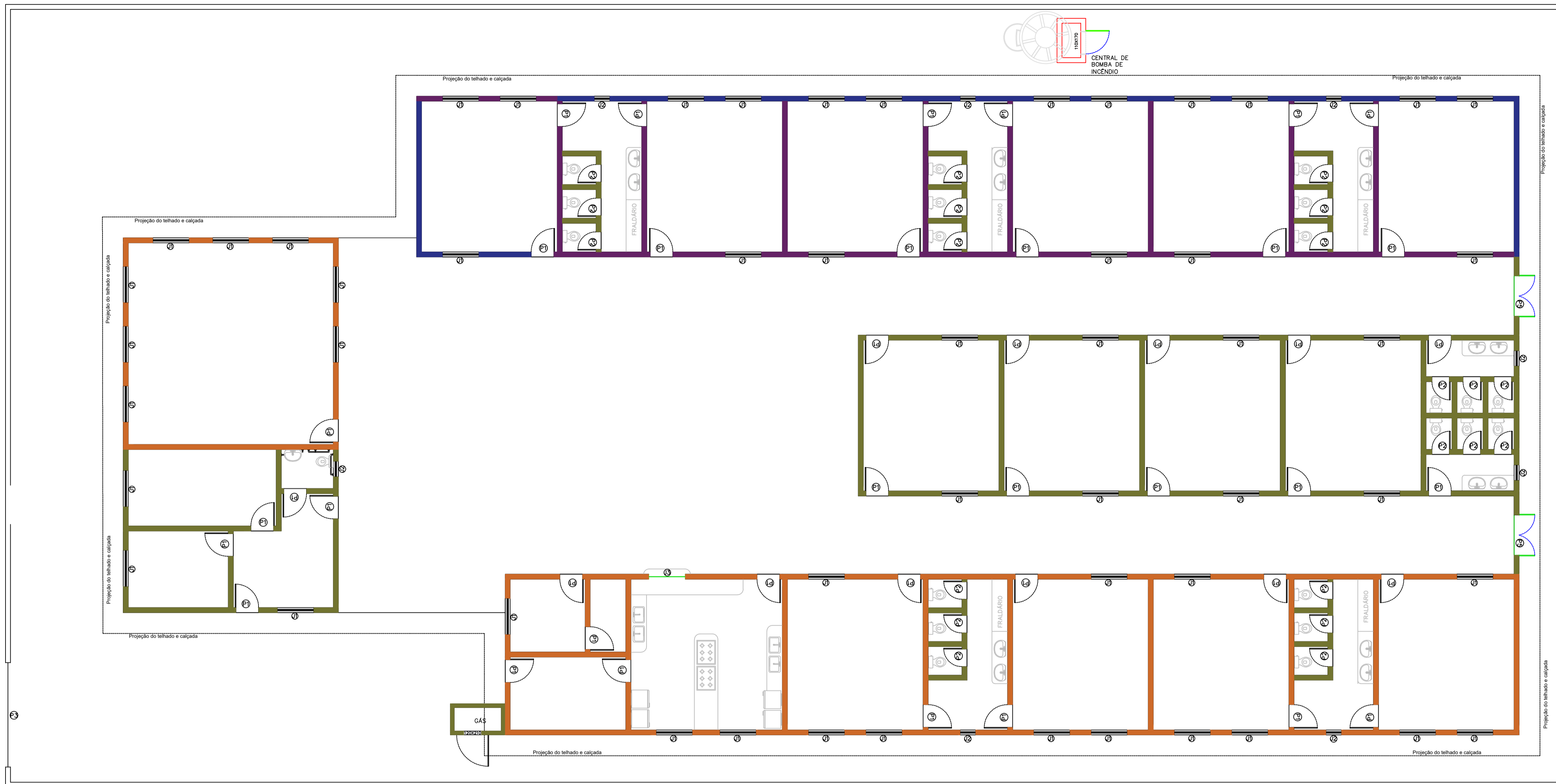
Planta Baixa de Serviços Executados ESC.: 1:100

TODAS AS NORMAS DE SEGURANÇA DO TRABALHO DEVEM SER SEGUIDAS, OS TREINAMENTOS DEVEM SER REALIZADOS, OS DOCUMENTOS SOLICITADOS PELAS NR's DEVEM ESTAR PRESENTES NA OBRA, SENDO DE RESPONSABILIDADE DA EMPRESA EXECUTANTE DA OBRA